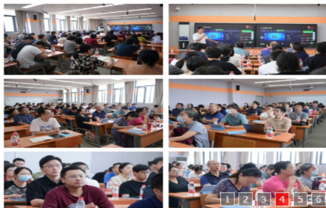
学校组织开展柔性实验室教学培训